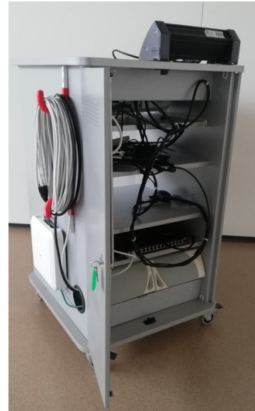
Vue arrière armoire multimédia et switch 16