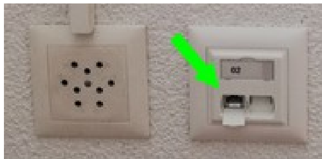
Prises 220 V et Ethernet, fond de salle à droite