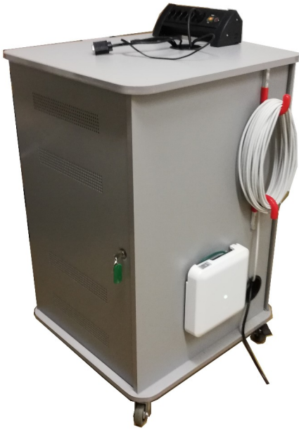
Vue avant armoire multimédia et borne WIFI